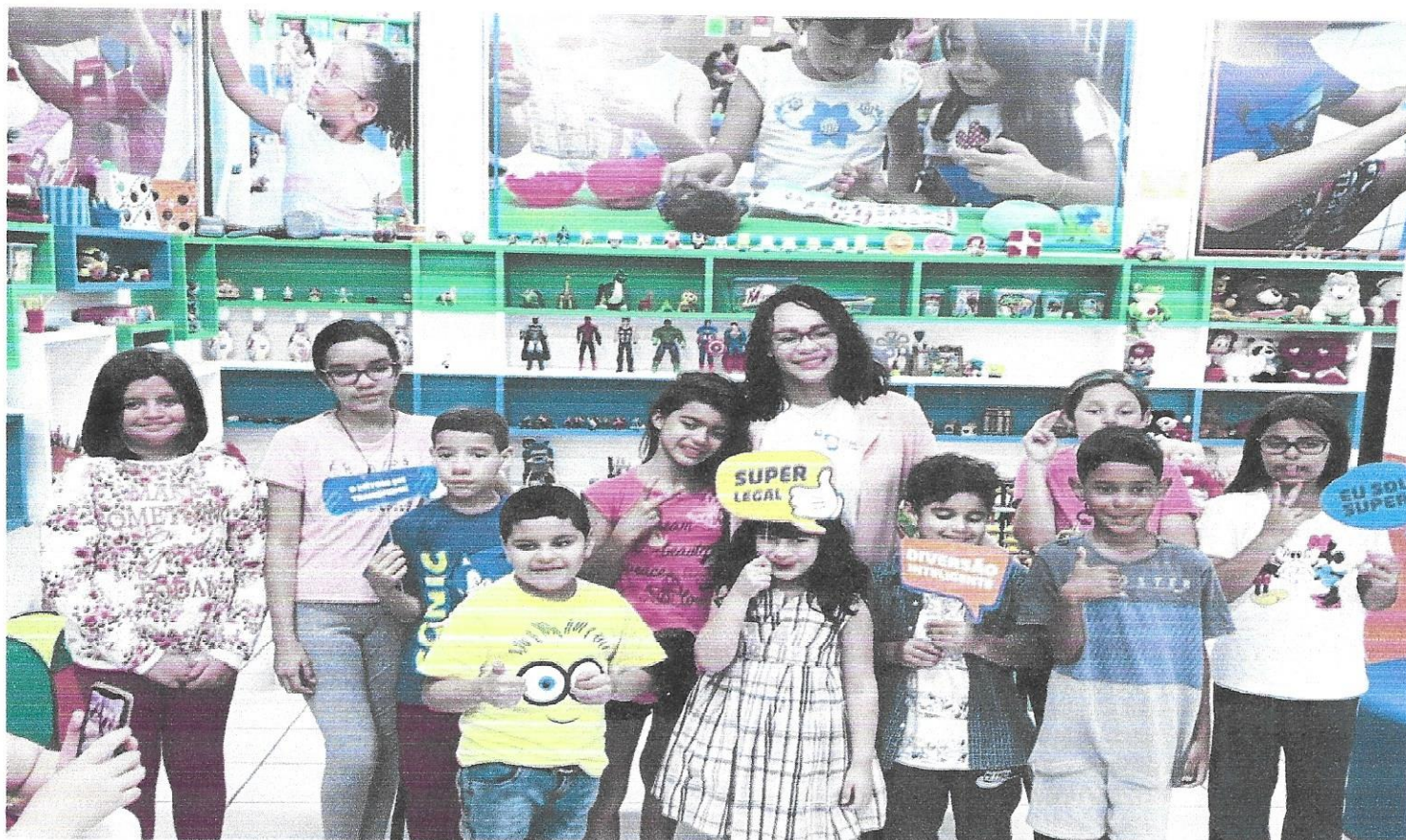
Oficina super cérebro