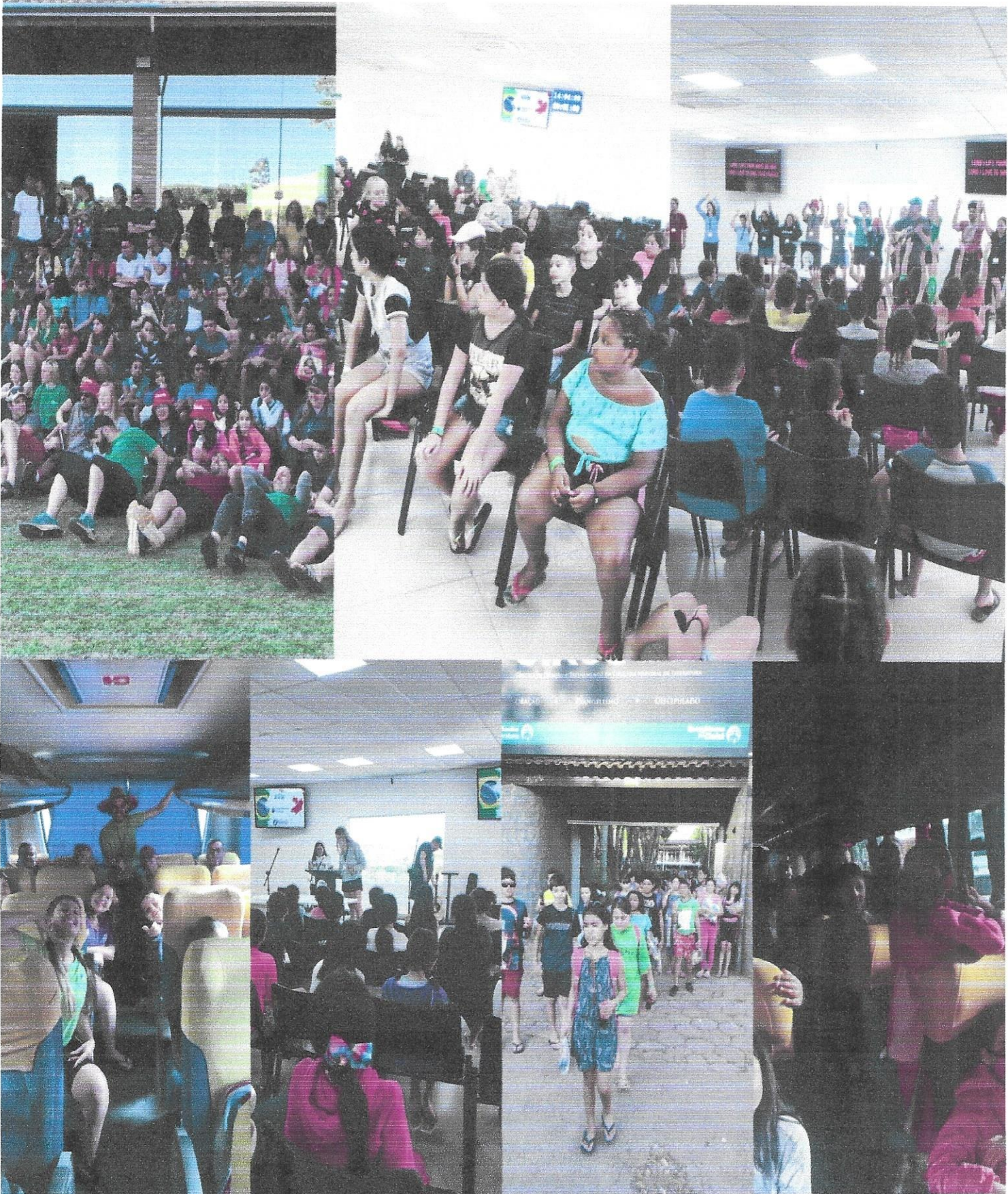
Passeios com Crianças e adolescentes.

Projeto: Associação Joseense de Ação Social – 6 á 15 anos – TC nº52/2018