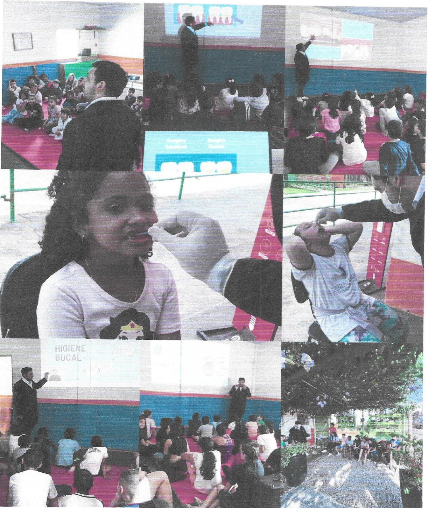
Atividade com profissionais de saúde

Projeto: Associação Joseense de Ação Social – 6 à 15 anos – TC nº52/2018