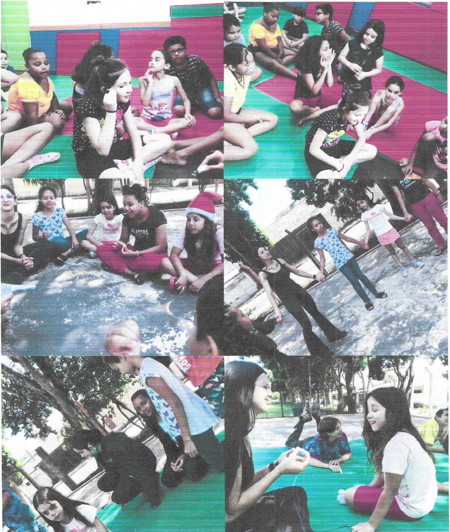
Palestra - Dia do palhaço criança

Projeto: Associação Joseense de Ação Social – 6 á 15 anos – TC nº52/2018