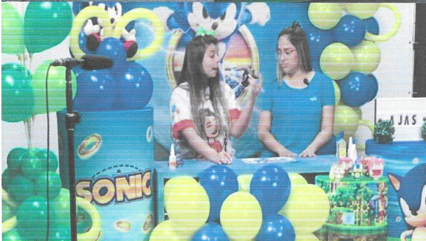
Gravação de vídeos pedagógicos