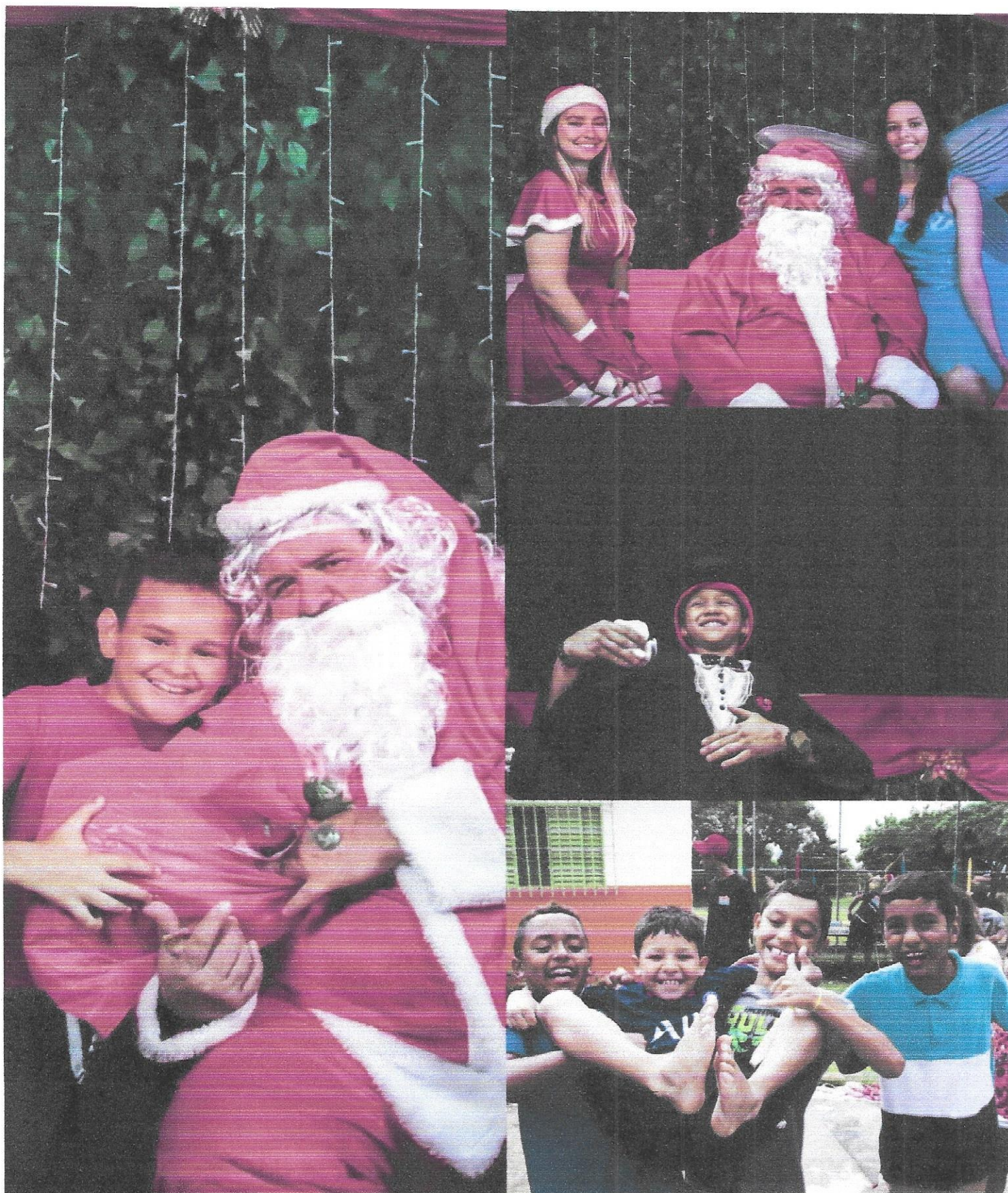
Festa de encerramento crianças

Projeto: Associação Joseense de Ação Social – 6 á 15 anos – TC nº52/2018