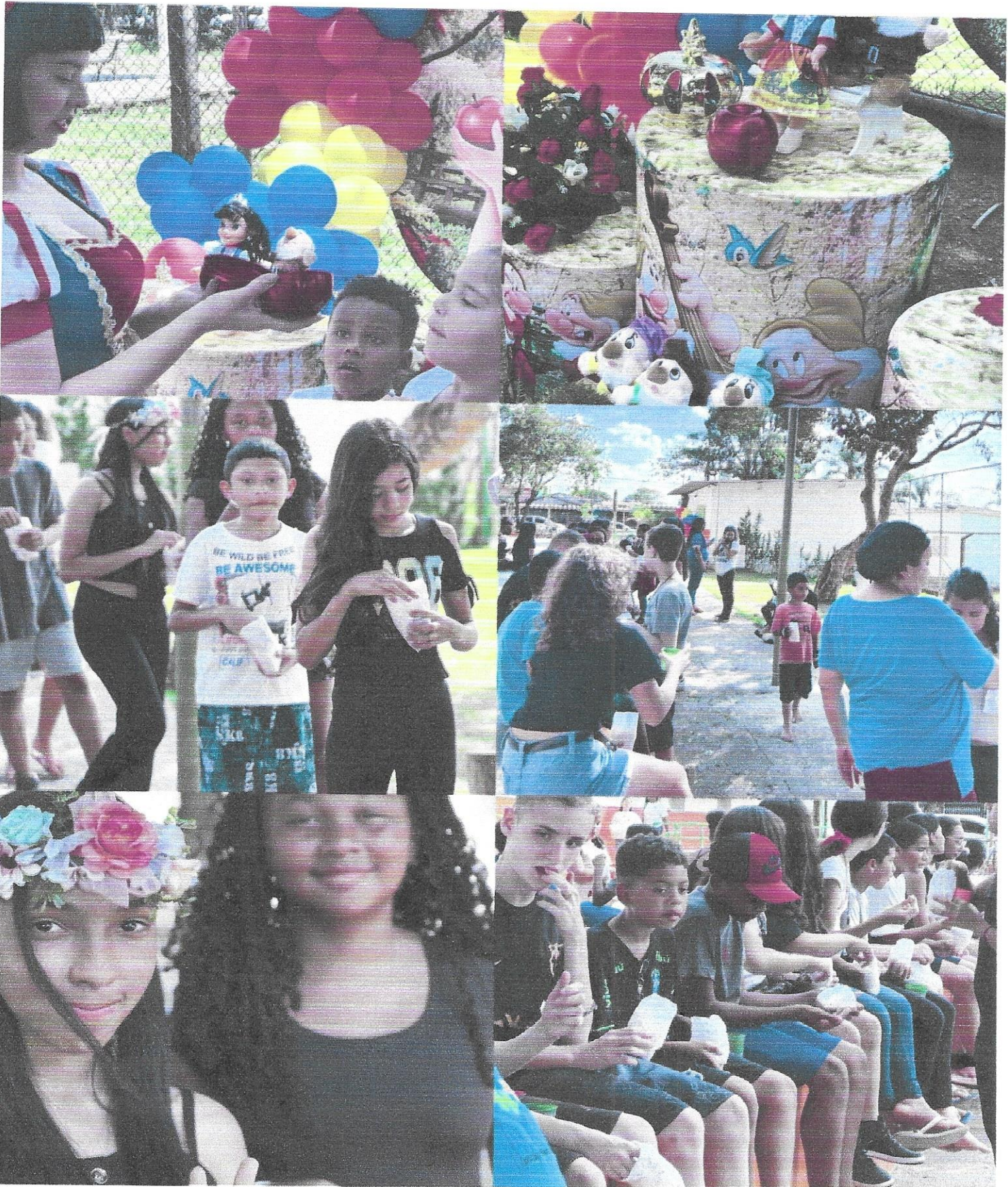
Festa de aniversário adolescentes.

Projeto: Associação Joseense de Ação Social – 6 á 15 anos – TC n°52/2018