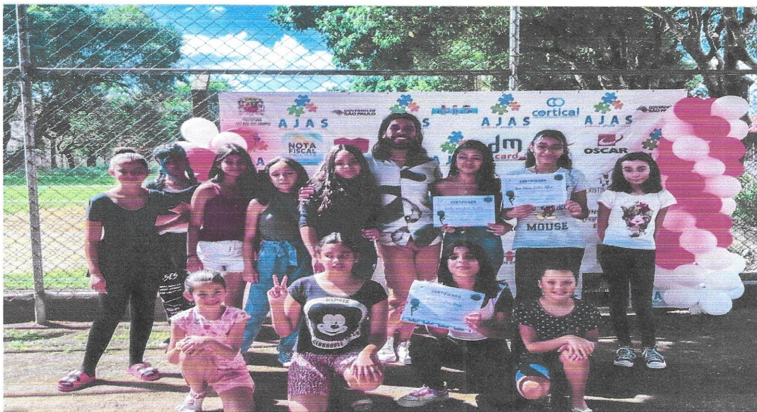
Oficina de jazz

Projeto: Associação Joseense de Ação Social – 6 á 15 anos – TC nº52/2018