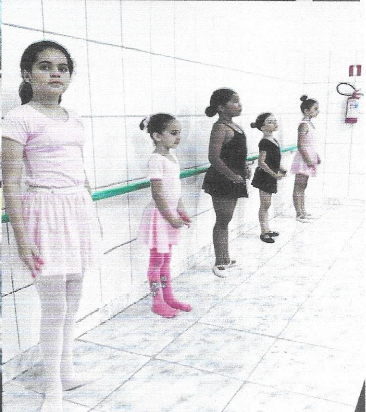
Oficina de ballet