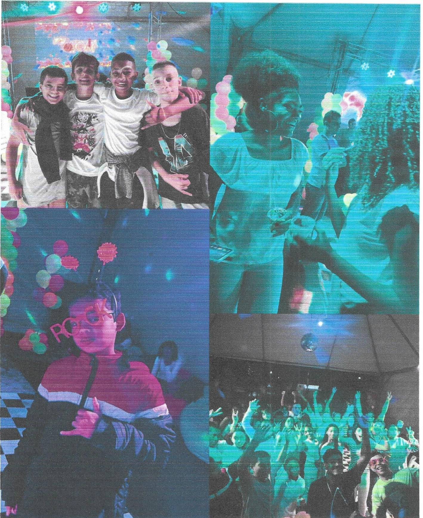
Festa de encerramento adolescentes.

Projeto: Associação Joseense de Ação Social – 6 à 15 anos – TC nº52/2018