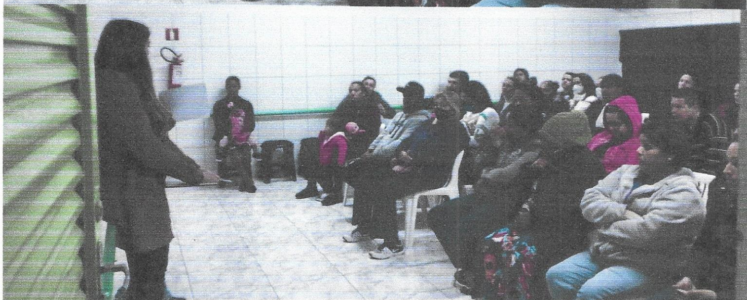
Reuniões de pais e responsáveis.